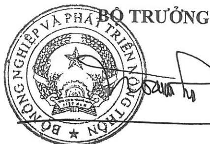
Lê Minh Hoan